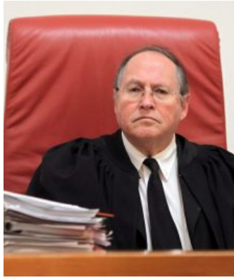
השופט אליקים רובינשטיין

פרטני, הרי שחלק גדול מהמקרים שמגיעים לעליון הם עקרוניים ובעלי השלכות על הציבור הרחב.